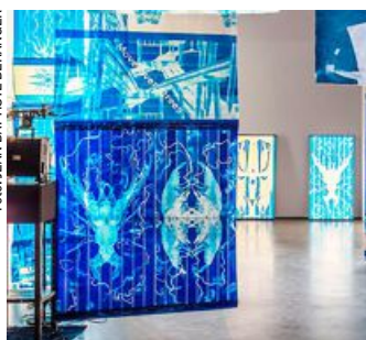
Installationsvy över "Highway gothic" av Edgar Cleijne och Ellen Gallagher.

sa sig komma från Saturnus, han tycks ha sett det kosmiska som en utopisk frizon bortom klassförtryck, miljöförstöring och rasism.